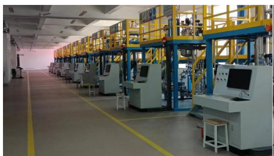
危险化学品工艺操作实训车间

培训项目包括：①企业主要负责人、安全员取证培训；②特种作业人员取证培训(危险化学品安全作业、电工、焊工、高处作业等)；③特种设备安全管理和作业人员培训。