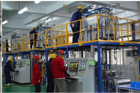
化工生产技术比赛现场