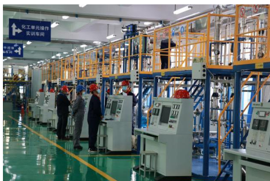
化工单元操作实训车间

培训项目包括：①新员工岗前培训；②老员工继续教育；③化工企业安全教育培训；④班组长能力提升；⑤职业卫生主要负责人及管理人员培训取证等。