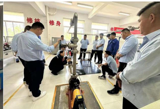
化工设备检维修实训室