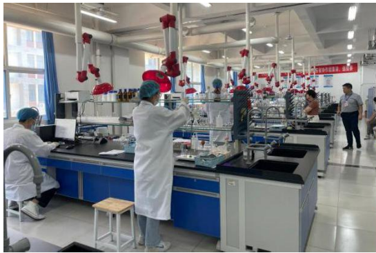
化学实验技术比赛现场

培训项目包括：①化学实验技术大赛；②化工生产技术大赛；③现代化工HSE 大赛；④化工机泵安全运行与检修职业技能大赛。