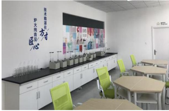
福瑞达美业商学院