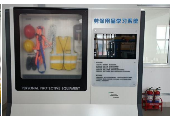
化工安全教育实训室