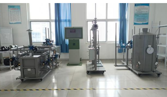
煤化工作业实训车间