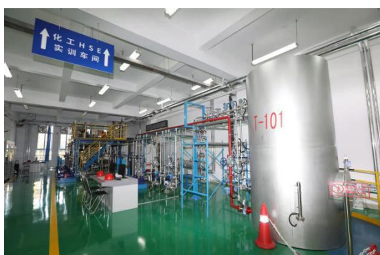
化工 HSE 实训车间