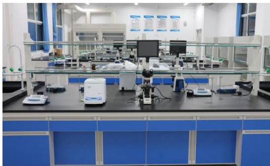
产品质量检验实训室

职业技能等级鉴定种类包括：①化工总控工、有机合成工、化学检验员、化妆品配方师；②仪器仪表维修工、化工检修钳工；③水生产处理、工业废水处理；④大气环境监测员、工业固体废物处理处置工；⑤发酵工程制药、水环境监测员（以上均包括初、中、高级）。